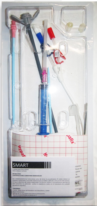
Contenido del equipo